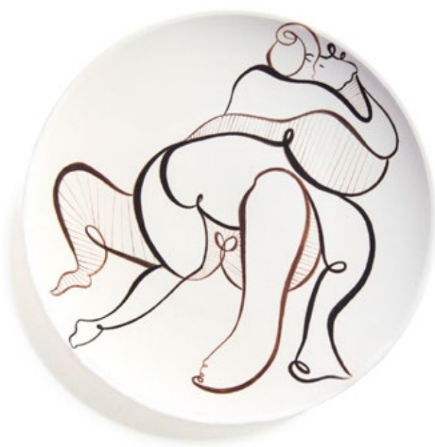
Ceramic Sequences . Andrea Santamarina